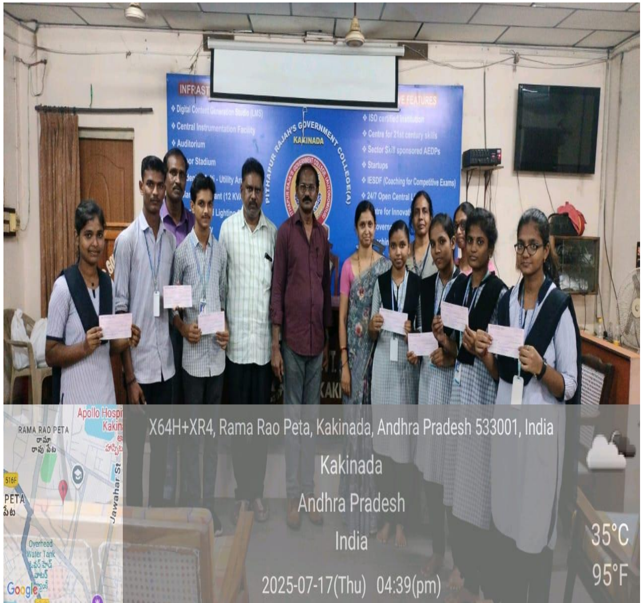
Principal Sir along with the Staff & Students